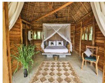
Gal Oya Lodge

Saisonaufpreise bei Qatar Airways ab Deutschland: 31.03. - 08.04. + 14.07. - 06.08. + 50 € Wochenendzuschläge bei Abflug am Fr. / Sa. + 40 €