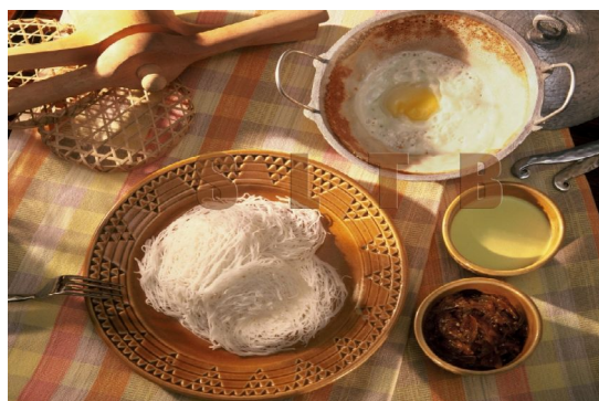
Spezialität aus Sri Lanka: Stringhoppers mit Chilli-Sauce

Ort: Negombo Goldi Sands 3,5* Standard – DZ/ÜF ab 429 €